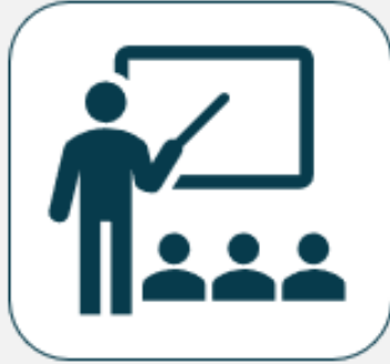
Referate und Webinare